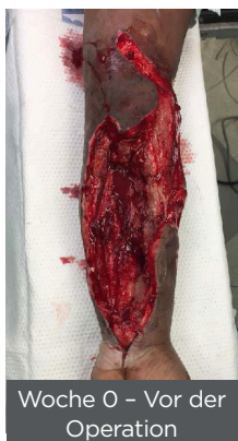
Woche 0 - Vor der Operation

Myriad Matrix™ ermöglicht die sofortige Abdeckung von freiliegenden Knochen, Sehnen und Vitalstrukturen, um den Aufbau von Granulationsgewebe zu unterstützen. Sie unterstützt zudem das Wachstum von robustem, gut vaskularisiertem Granulationsgewebe für eine erfolgreiche Spalthauttransplantation. 3,4